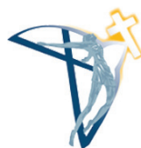
CVS E SILENZIOSI OPERAI DELLA CROCE